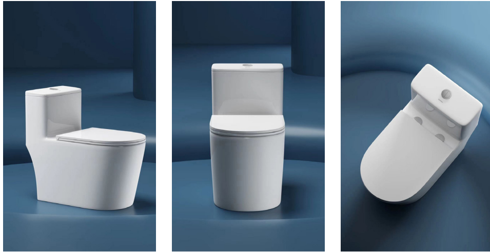
Bồn cầu đặt sàn Morris MR388103